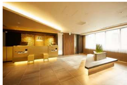
hotel MONday 京都丸太町