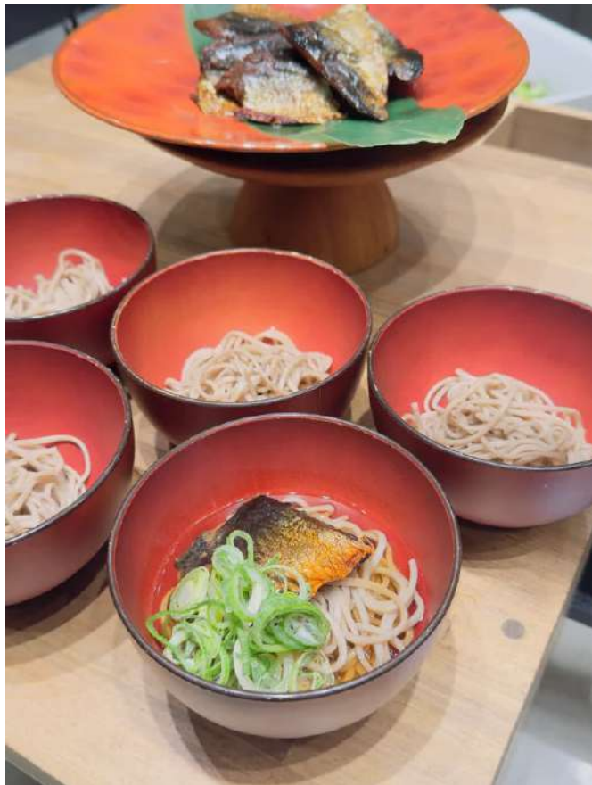
新メニュー京都の名物「ニシン蕎麦」

地元の味覚も楽しめるホテルとして、より一層ご満足いただける内容をご提供いたします。