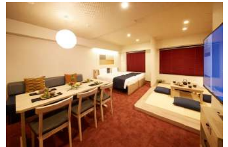
MONday Apart Premium 京都駅