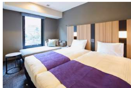
hotel MONday 京都烏丸二条