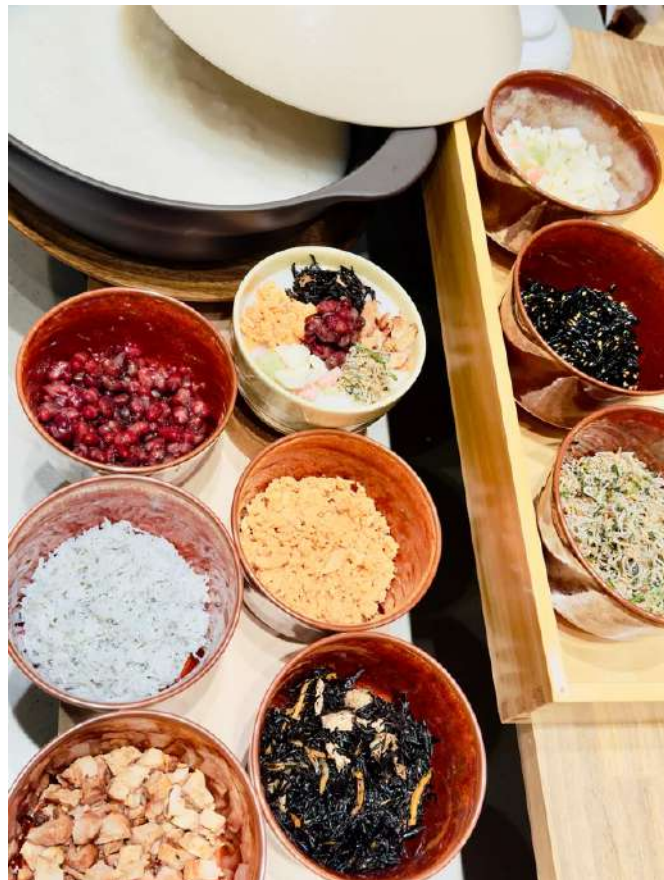
「ニシン蕎麦」以外の朝食メニュー

今回のリニューアルにより、より快適で多目的な空間、そして京都ならではの魅力あるお食事をお楽しみいただけるレストランへ生まれ変わりました。